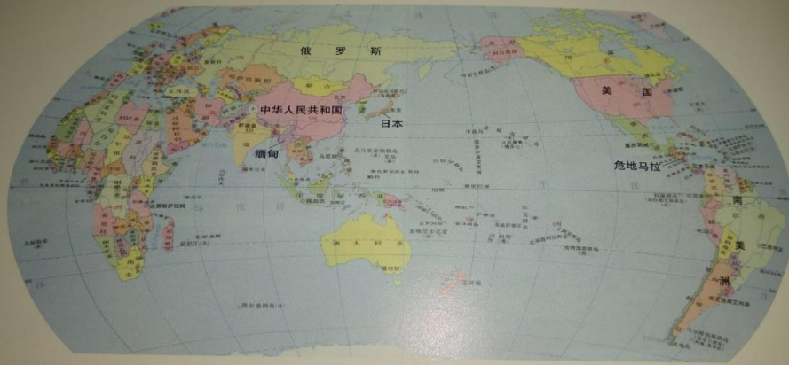
2-2 世界翡翠产地分布图 (笔者参考中国地图出版社出版的《世界地图册》编制)